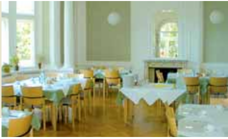
Speisesaal im Schloss

Auch die Frage der zukünftigen Teilnahme in einer Selbsthilfegruppe oder der weiteren Betreuung oder Behandlung in einer Fachambulanz bzw. Beratungs- und Behandlungsstelle sollte ausführlich mit uns besprochen werden. Die reguläre Entlassung erfolgt nach Ablauf der vereinbarten Behandlungszeit.