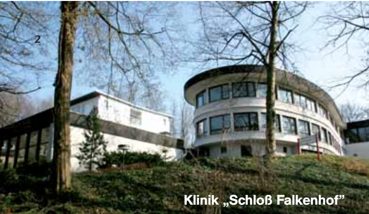
Klinik „Schloß Falkenhof“